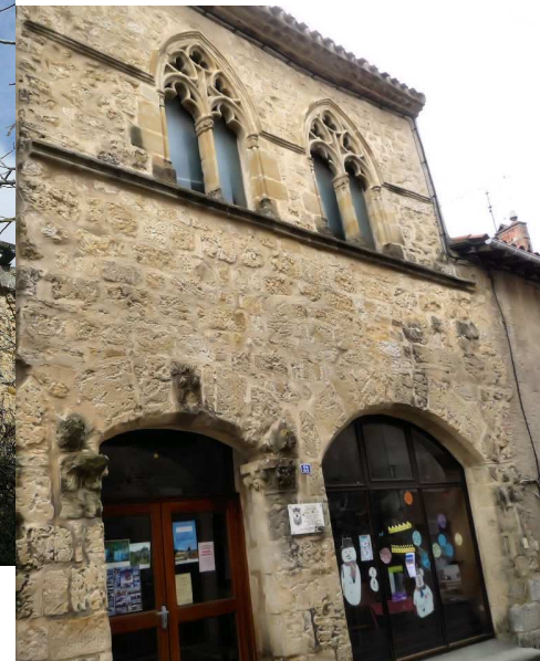
Belpech, la maison "de Curtis" .