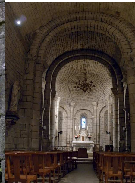
Eglise romane de Baraigne.