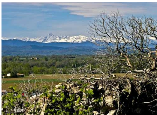
Les Pyrénées depuis les ruines du château de Belpèch.

Sur les traces des cathares à Belpèch et dans le Lauragais audois