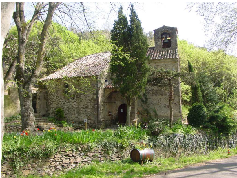
Eglise Saint-Saturnin de Palairac.