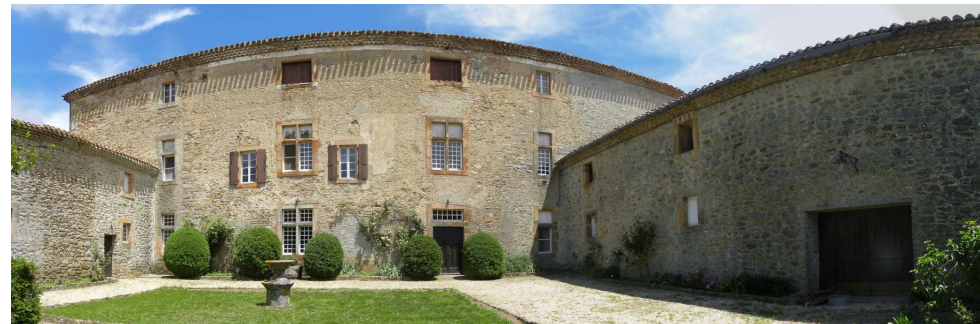
Le château de Bouisse.